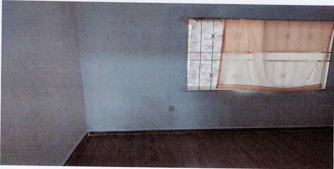
Foto 3 Pisos