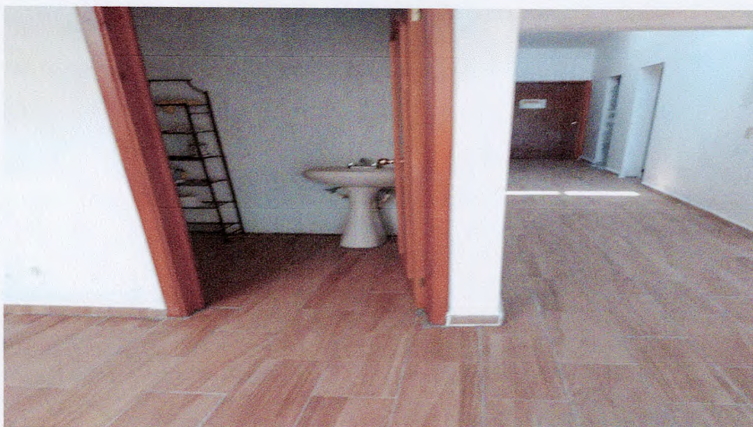
Foto 4 Instalaciones Sanitarias