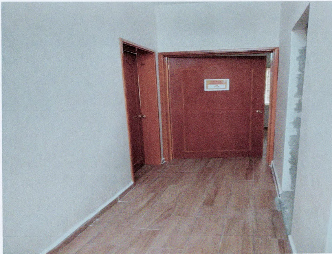
Foto 1 Acceso A La Bodega

Con la finalidad de mostrar como se encuentra actualmente las instalaciones de este Consejo que se designaron como bodega electoral, enseguida se presenta una muestra fotográfica del estado actual en que se encuentra: